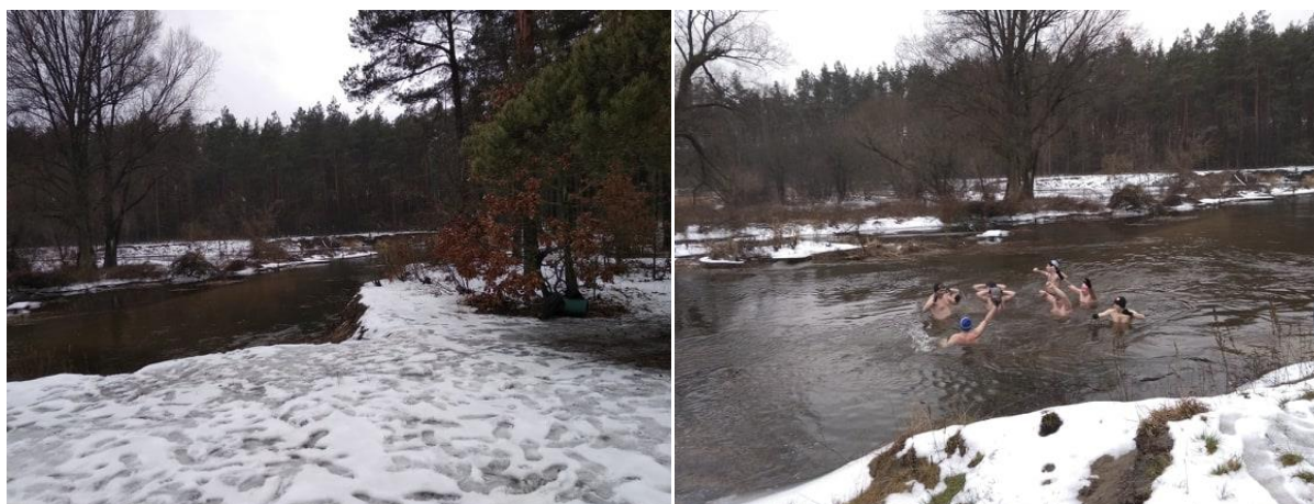
Morsowanie w rzece Grabia