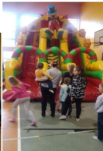
Zabawa na dmuchałkach