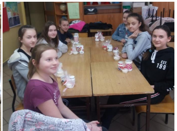
A oto efekty pracy dziewczyn.