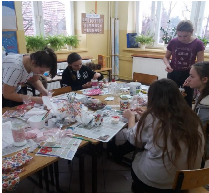
Podczas warsztatów artystycznych panował twórczy bałagan, zaangażowanie i mobilizacja. Dziewczyny fajnie spędziły czas i wyczarowały prawdziwe cudownka. Mamy zdolną młodzież ;)